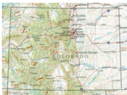
Figura 1 - Mappa del Colorado.

Afrodite Credo allora sia il momento di venire alla seconda tesi che intendiamo sostenere, cioè che i sessi sono categorie convenzionali i cui confini sono determinati per mezzo di una certa selezione di proprietà biologiche, ovvero i tratti sessuali . Un'analogia con le mappe geografiche ci aiuterà a chiarire questo punto. Osserva, per esempio, la mappa del Colorado.